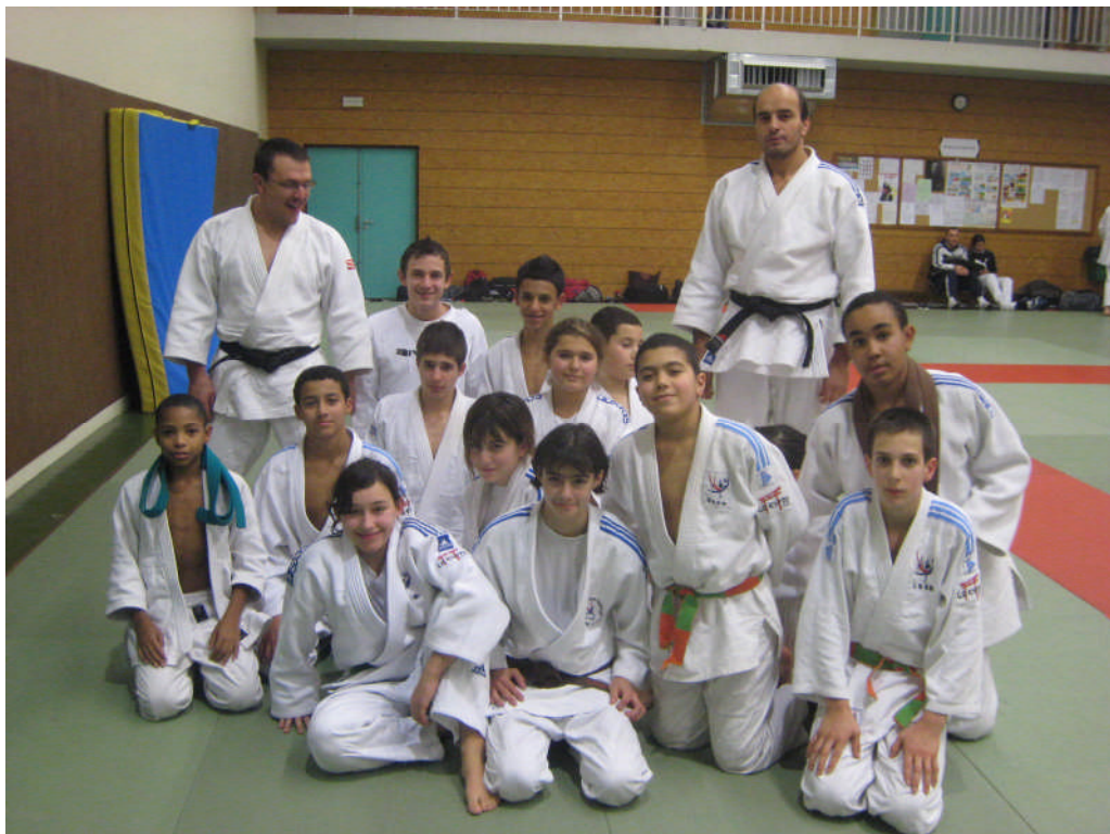
Le mercredi après midi au gymnase Hoche avec le Pole Espoir