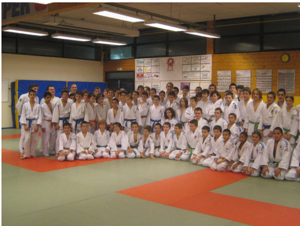
Regroupement des CDJ de Haute Savoie et de Savoie et de l'Isère à la Motte Servolex.