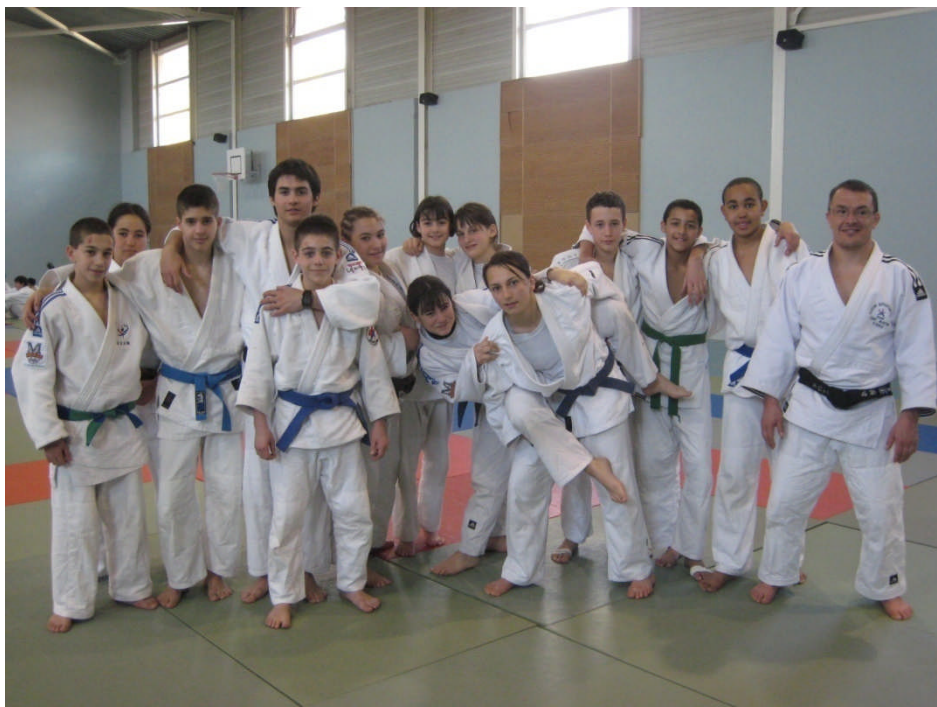
La CDJ en stage à AJACCIO (avril 2008) avec le Pole Espoir de la Corse